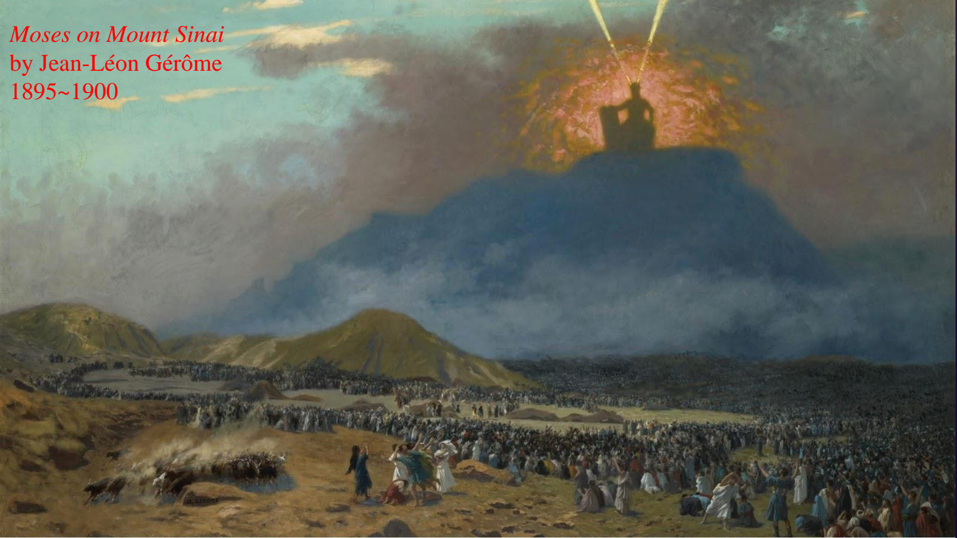
Moses on Mount Sinai by Jean-Léon Gérôme 1895~1900