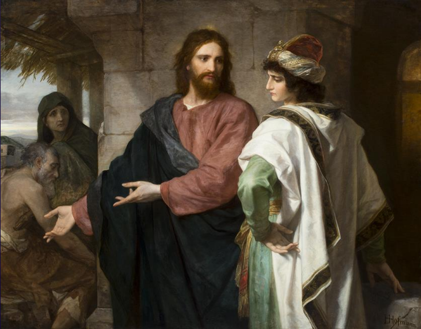
Christ and the Rich Young Ruler by Heinrich Hofmann 1889 at Riverside Church, NYC