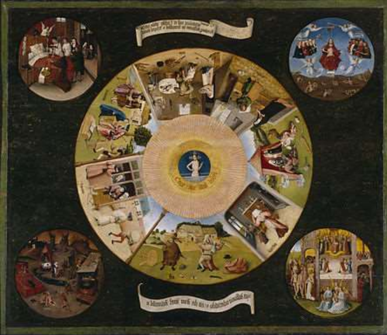
The Seven Deadly Sins and the Four Last Things by Hieronymus Bosch (disputed) c. 1500 at Museo del Prado, Madrid (details see Wikipedia)