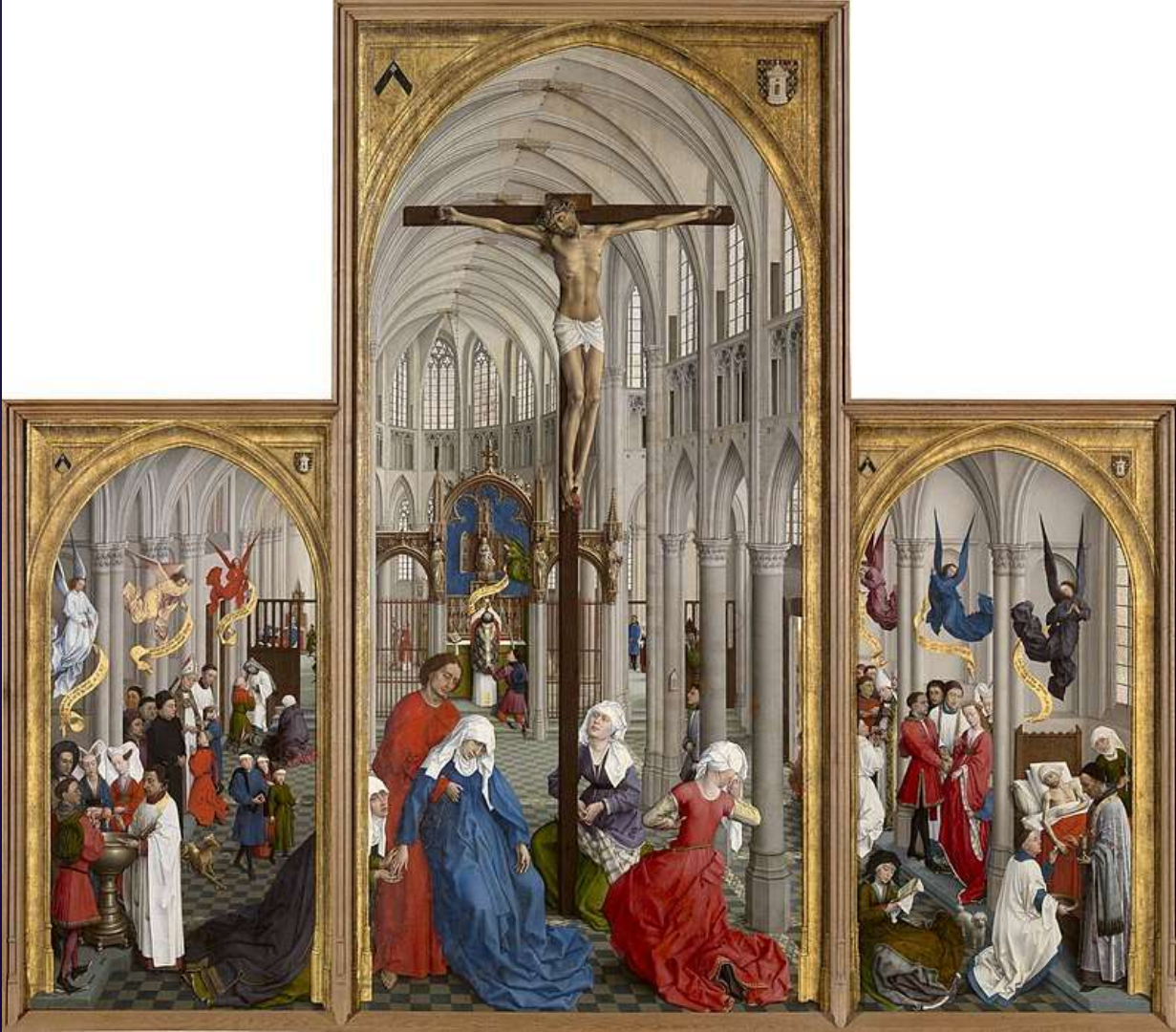
Seven Sacraments Altarpiece by Rogier van der Weyden c. 1448