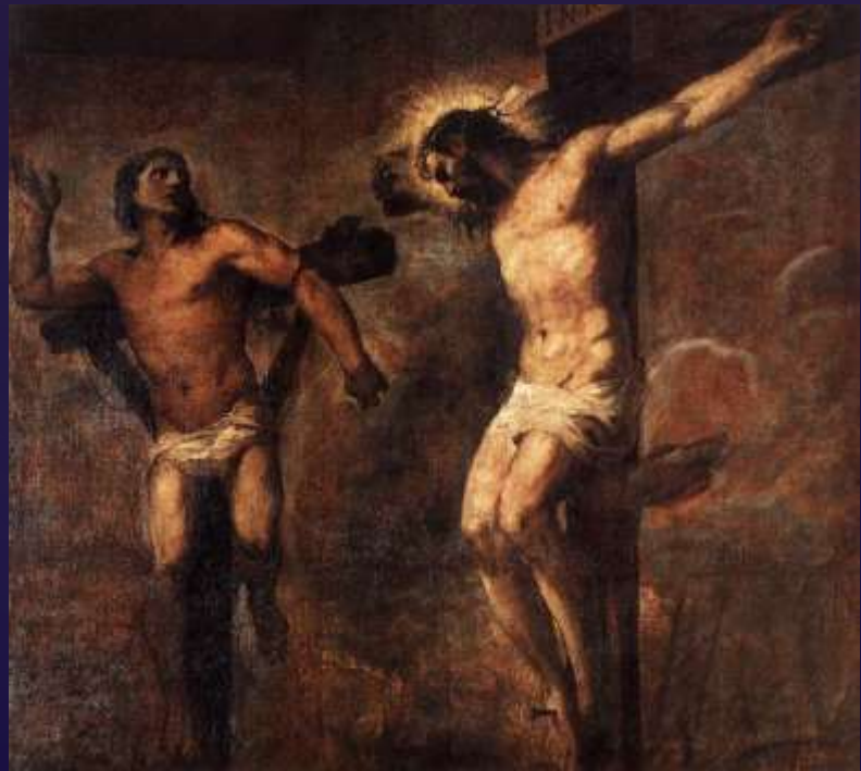
Christ & the Good Thief by Titian c. 1566

稱義是使我們從原罪的罪咎下，獲得全然的釋放。耶穌在十架上一次永遠地為我們的原罪釘死了，包括罪咎與敗壞。罪咎的赦免是一次永遠的，這是稱義的福份；當我們悔改信主時，一次永遠賜給。脫離罪惡權勢的自由，是從稱義而來的。